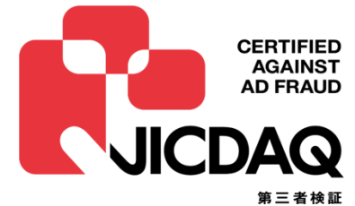
JICDAQ（一般社団法人デジタル広告品質認証機構）による認証の取得